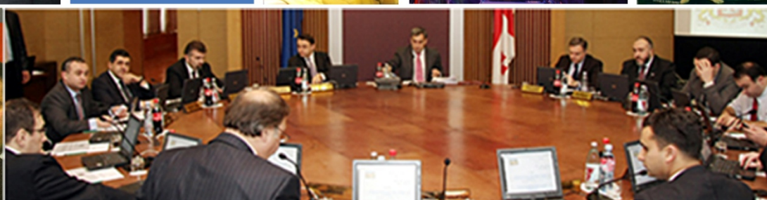
ראש הממשלה ושר הכלכלה להערכות לביקור