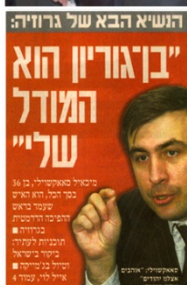
אייל לוי, מעריב